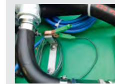
Cavo di messa a terra con pinza. Grounding cable with clamp.